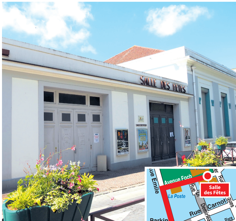
Salle des Fêtes 3, avenue Foch • Montmorency

Depuis novembre 2021, la Direction des Affaires Culturelles propose son grand temps fort Les Entretiens de Montmorency . Articulés en sessions de deux heures suivies d'un temps de convivialité, Les Entretiens ont pour objet d'installer un cycle de réflexions à caractère prospectif sur les grands débats et enjeux d'aujourd'hui et de demain.