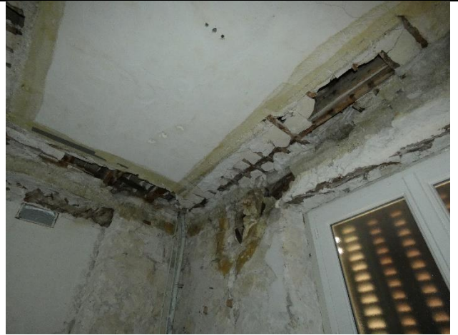
plafond de la salle de bain du premier étage partiellement détruit