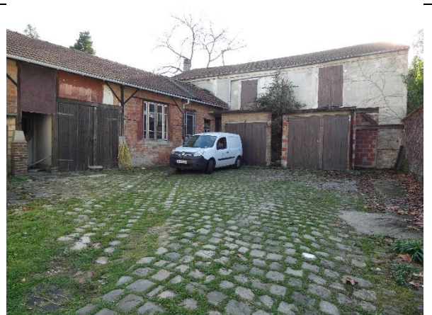
A gauche la grange à droite 2 garages surplombés d'un atelier