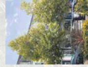
Platanus à feuilles d'érable Feuillage caduc