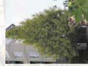
Ormes champêtre Feuillage caduc