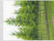
Charme commun fastigié Feuillage caduc