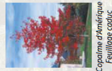
Coccoloba d'Amérique Feuillage caduc

Si oui, quels arbres souhaiteriez-vous planter sur cette place ?