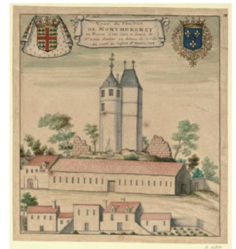
Vue du chasteau de Montmorency en France, à une lieue et demie de Saint-Denis, dessiné en dehors de la Ville de l'église St-Martin de Louis Boudan, 1708.