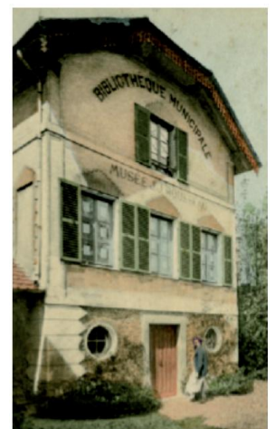
Le premier musée Jean-Jacques Rousseau en 1899, musée Jean-Jacques Rousseau.

En 1906, la collection déménage de nouveau et le musée est accueilli au 1 er étage du nouvel Hôtel de Ville. Reparti dans deux petites salles, le musée comprend la collection liée au philosophe et une autre dédiée à l'histoire de Montmorency. L'espace étant trop étroit, la ville achète la propriété du Mont-Louis, seconde habitation du philosophe à Montmorency, en 1946. Après y avoir effectué de longs travaux d'aménagement, ce troisième musée est inauguré en 1952. Il est rénové en 2012 à l'occasion du tricentenaire de la naissance du philosophe.