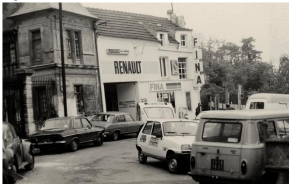
Garage Renault, 2 e moitié du XX e siècle