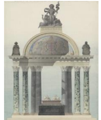
Mausolée d'Anne de Montmorency (démantelé à la Révolution)