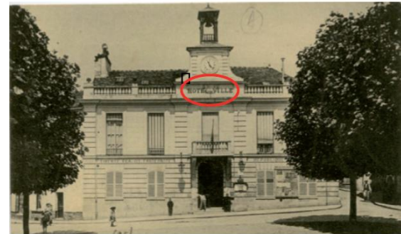
Hôtel de Ville en 1904, musée Jean-Jacques Rousseau.

Construit en 1784 par le Prince de Condé, dernier seigneur de Montmorency, cet édifice sert d'Auditoire de justice jusqu'en 1790. La moyenne et basse justice (Injures, coups et blessures...) y sont jugées par le bailli* au nom du seigneur. Avant la Révolution, les seigneurs rendent la justice sur leurs terres. La Révolution supprime le pouvoir de justice des seigneurs et l'Auditoire de Montmorency devient la Justice de paix, placée sous la responsabilité d'un juge. Le bâtiment comprend alors: une salle de conseil, une salle d'audience, le cabinet du juge de paix, une cellule de la pistole (réservée aux prisonniers fortunés) et 4 cachots disposés autour de la cour. Racheté en 1809 par la municipalité, il abrite l'Hôtel de ville jusqu'en 1906. *À l'origine, c'est le bailli, un officier d'épée ou de robe, qui rend la justice au nom du roi ou d'un seigneur.