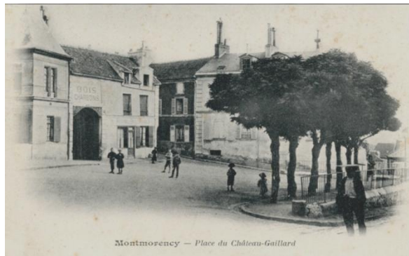
Magasin de charbon et de bois, 1 e moitié du XX e siècle