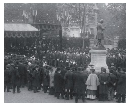
Inauguration de la 1 re statue, le 27 octobre 1907.