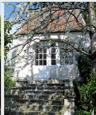
Le « Donjon », cabinet de travail du philosophe

« Ce Donjon, qui terminait une allée en terrasse, donnait sur la vallée et l'étang de Montmorency [...] Ce fut dans ce lieu, [...] que je composai dans l'espace de trois semaines ma Lettre à d'Alembert sur les Spectacles ».