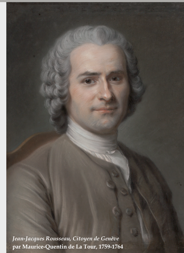
Jean-Jacques Rousseau, Citoyen de Genève par Maurice-Quentin de La Tour, 1759-1764

Ainsi s'écoulaient dans un délire continuels les journées les plus charmantes que jamais créature humaine ait passées.