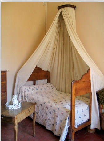
Chambre de Thérèse Levasseur

Des visites thématiques pour les collèges et lycées sont également proposées.