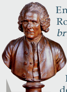
Jean-Jacques Rousseau par Houdon

En avril 1756, Jean-Jacques Rousseau fuit Paris, « ville de bruit, de fumée et de boue », et s'installe à Montmorency, au lieu-dit l'« Hermitage ».