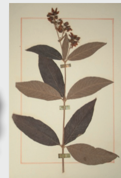
Herbier réalisé par Jean-Jacques Rousseau pour Madelon Delessert