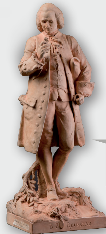
Rousseau herborisant par A. E. Carrier Belleuse